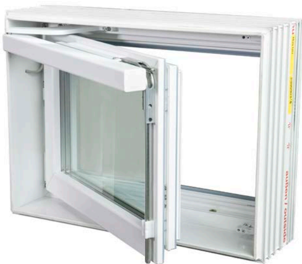
ACO Therm® 3.0 Zuluftfenster für Rauch- und Wärmeabzugsanlagen mit elektrischem Antrieb zur Öffnung