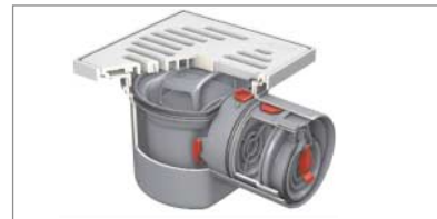
ACO Kellerablauf JUNIOR mit Rückstauverschluss