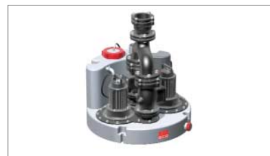
ACO Hebeanlage MULI-STAR