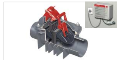
ACO Fäkalien-Rückstauautomat QUATRIX-K Typ 3F