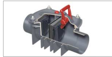
ACO Doppelrückstauverschluss TRIPLEX-K-2