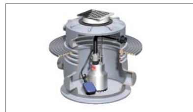
ACO Hebeanlage SINKAMAT