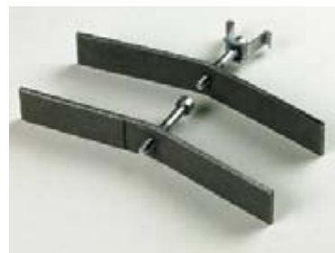
Rostarretierungen: - für Maschenrost (hinten) - für Gussrost (vorn)