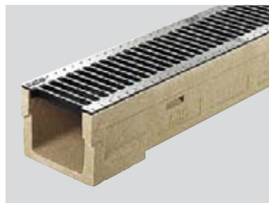
Rinne mit Gussrost