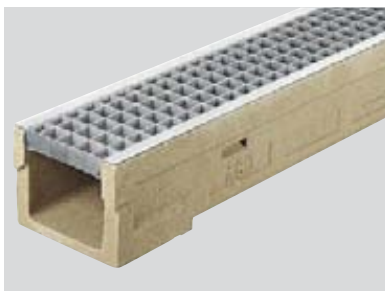
Rinne mit verzinktem Maschenrost