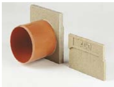
Stirnwand mit Stutzen und geschlossene Stirnwand für Rinnenanfang/-ende