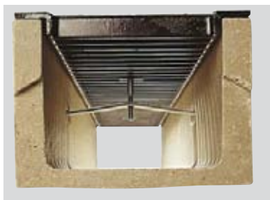
Zur Sicherheit können die Roste auf den Rinnen mit Arretierungen (2 pro Meter) befestigt werden.

Dafür schlagen Sie die vorgesehenen Vorformungen der Rinne auf , setzen Sie die Laschen in die Kammern und verschrauben Sie die Roste. Stützen Sie die Seiten der Rinnen und Stirnwände mit Beton, lassen Sie ausreichend Platz für den späteren Oberflächenbelag.