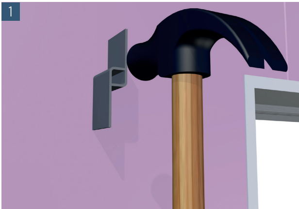
1 Distanzhalter an angezeichneter Position in die Dämmung einschlagen. Ggf. vorher die Dämmung etwas einschneiden