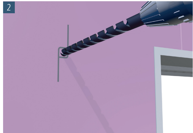
2 16 mm Bohrloch mit Schlagbohrmaschine durch den Distanzhalter hindurch in die Betonwand erstellen