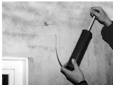
4. Bohrlöcher reinigen.