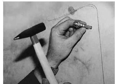
5. Die beiden oberen Schwerlastdübel einschlagen.