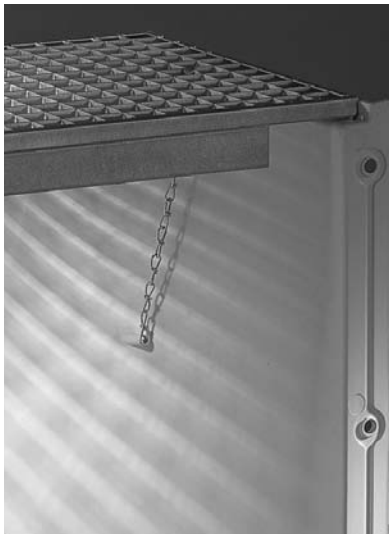
1. Lichtschachtrost einsetzen und Rostabhebesicherung einbauen.