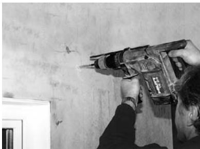
3. Die beiden obersten Löcher mit Tiefenanschlag (7 cm) bohren. Achtung: nicht zu tief bohren!

Wenn keine Wasserwaage zur Verfügung steht, halten Sie den Lichtschacht mit eingelegtem Rost an die Wand und kennzeichnen die Position der beiden oberen Bohrungen.