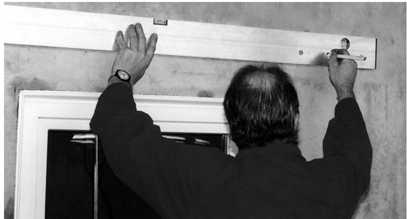
2. Die Lage des Lichtschachtes bestimmen (Oberkante Lichtschacht, Mitte Fenster) und mit der Montagehilfe für Lichtschächte die beiden obersten Löcher anzeichnen. (OK Montagehilfe = OK Lichtschacht) Den Lichtschacht anhalten und die Kontur grob mit dem Bleistift markieren.

Der Abstand von der Fensterunterkante bis zum Lichtschachtboden muss \geq 15 cm (gem. DIN 18195) betragen.